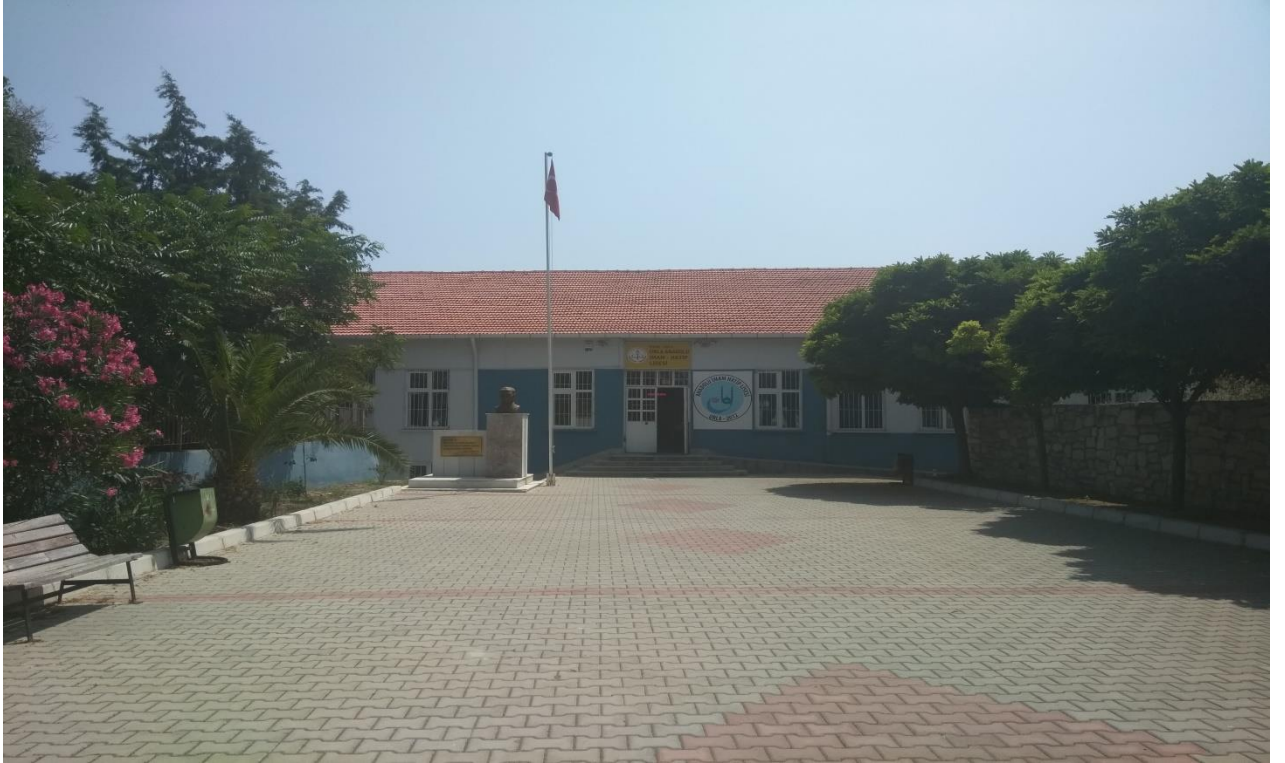
URLA ANADOLU İMAM HATİP LİSESİ