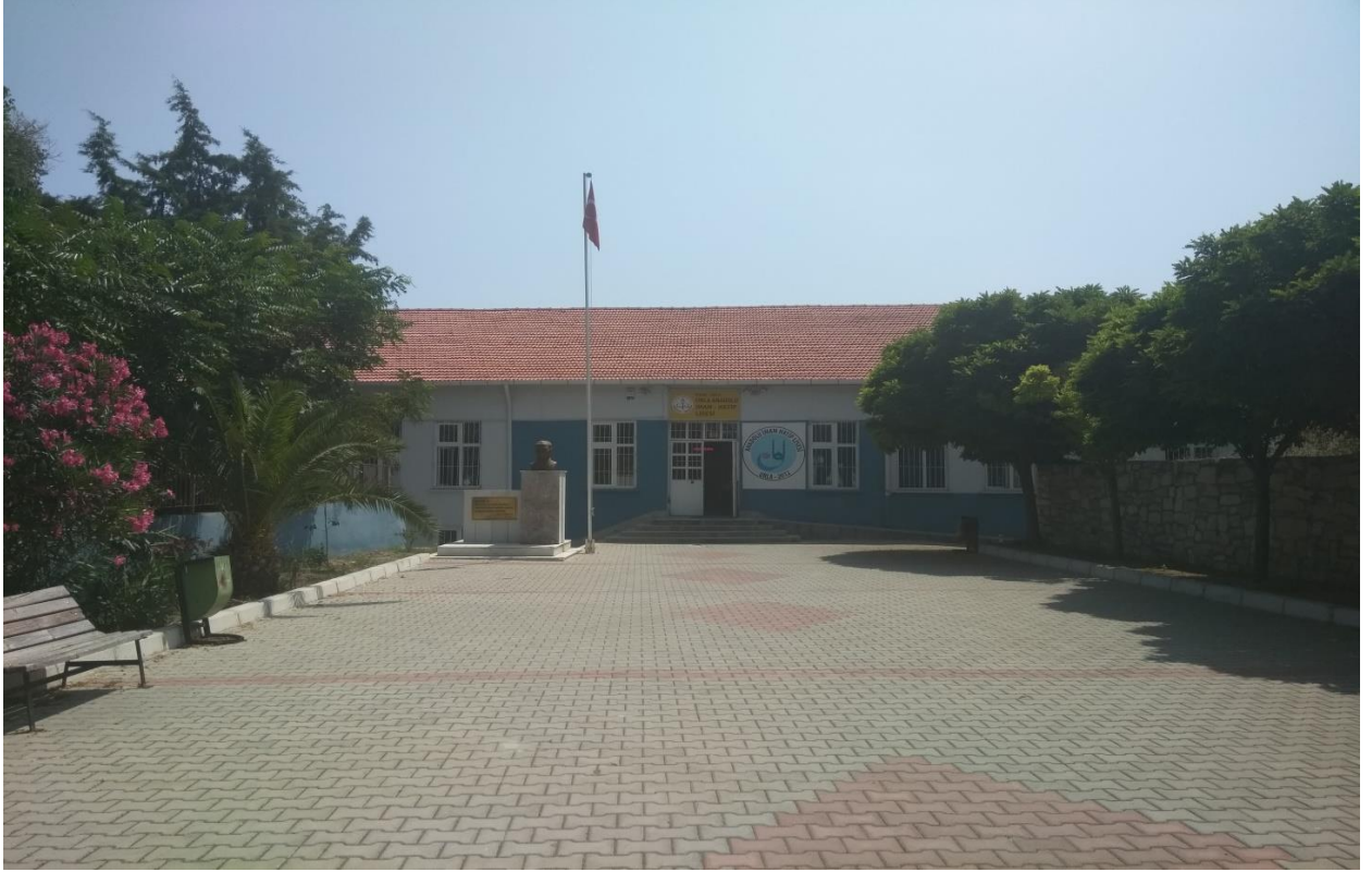
URLA ANADOLU İMAM HATİP LİSESİ